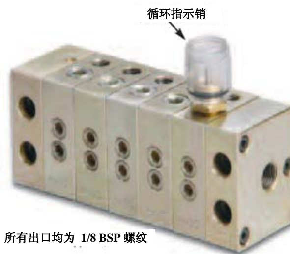
所有出口均为 1/8 BSP 螺纹

配送润滑脂的递进式分配器由数组独立的阀块合成，每个阀块排送独立排量的润滑脂，这样可以令设备上不同的润滑点得到不同分量的润滑剂，从而达到精确润滑的效果。